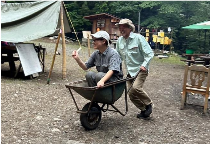
図 1 文字だけだとさびしいので、冒険学校の非学校的なところの象徴みたいな図。いいよねこの写真。